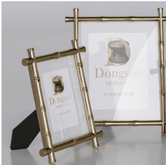
NÉT XƯA CD2 ( Combo 2 sản phẩm bất kỳ )