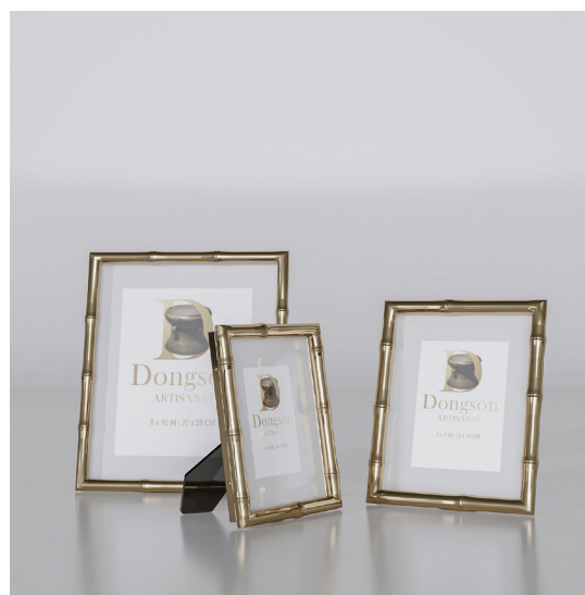
NÉT XƯA CV3 ( Combo 3 sản phẩm )