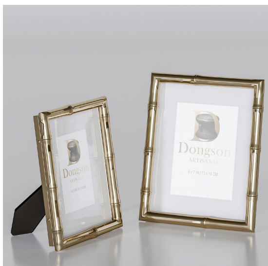
NÉT XƯA CV2 ( Combo 2 sản phẩm bất kỳ )