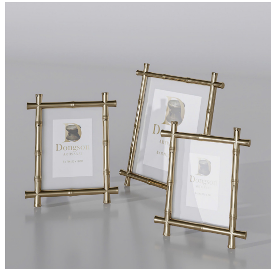
NÉT XƯA CD3 ( Combo 3 sản phẩm )